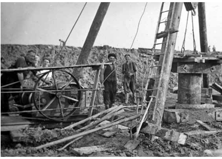
Es war viel Arbeitskraft notwendig: hier beim Bau des Ledasperrwerkes (um 1952).