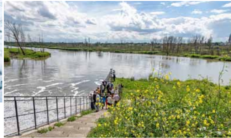
Kruiibeke Polder: Das Einlassbauwerk mit dem berühmten Wasserfall und ein Blick ins Innere des Polders, der den Anwohnern Erholung bietet.

den Pegel zu senken. Auf der anderen Seite des Areals wurde auf sechs Kilometern Länge ein Ringdeich gebaut, der die angrenzenden Siedlungen im Hochwasserfall vor dem Wasser schützt.