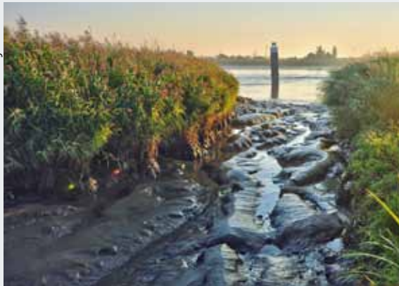
Schlickablagerungen im Seitenbereich der Ems

gehalt sinkt deutlich, der Sauerstoffgehalt steigt deutlich, Salzgehalte gehen zurück. Die Tideniedrigwasseranhebung soll stets direkt nach dem Winter starten, wenn das System durch die hohen Wassermengen aus dem Binnenland während der kalten Jahreszeit wenig Flüssigschlick enthält, und so die Unterems über den Sommer in diesem Zustand erhalten. Die Unterhaltungsbaggerungen können effektiver erfolgen, weil die Sedimente am Boden kompakter sind. Langfristig nehmen Baggerdauer und Baggermenge ab.