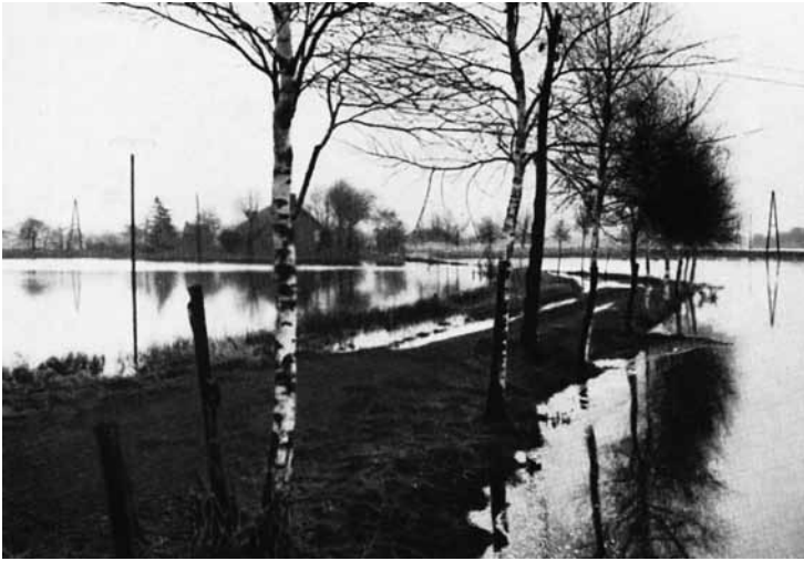
Ein ganz normales Bild in den Wintermonaten - Überschwemmungen in den Niederungen (hier: Hollen).