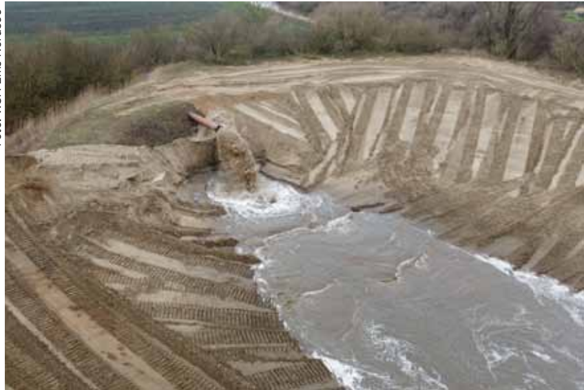
Beweis für den Sandgrund der Ems: Das Sandlager des WSA in Coldemüntje hatte viel Baggergut zu schlucken.

sie ein einstimmiges Votum des Lenkungskreises. Der Bund, vertreten durch die Generaldirektion Wasserstraßen- und Schifffahrt (GDWS) und das Wasserstraßen- und Schifffahrtsamt (WSA) Ems-Nordsee, übernahm es, gemeinsam mit den Vertretern von Emsschifffahrt, Hafenwirtschaft und Freizeitschifffahrt eine verkehrsverträgliche Tidesteuerung zu entwickeln. Das Land, vertreten durch das Umweltministerium und den Niedersächsischen Landesbetrieb für Wasserwirtschaft, Küsten- und Naturschutz (NLWKN) inklusive der Forschungsstelle Küste waren für den Nachweis der Wirksamkeit und der Verträglichkeit mit der Binnenentwässerung zuständig. Wobei sich die Aufgaben auch überschneiden; so arbeitete die FSK in vielen Fragen eng mit der Bundesanstalt für Wasserbau zusammen.