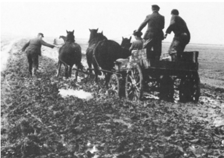
Einst ein normales Bild: Kaum nutzbarer Wirtschaftsweg im Winterhalbjahr.