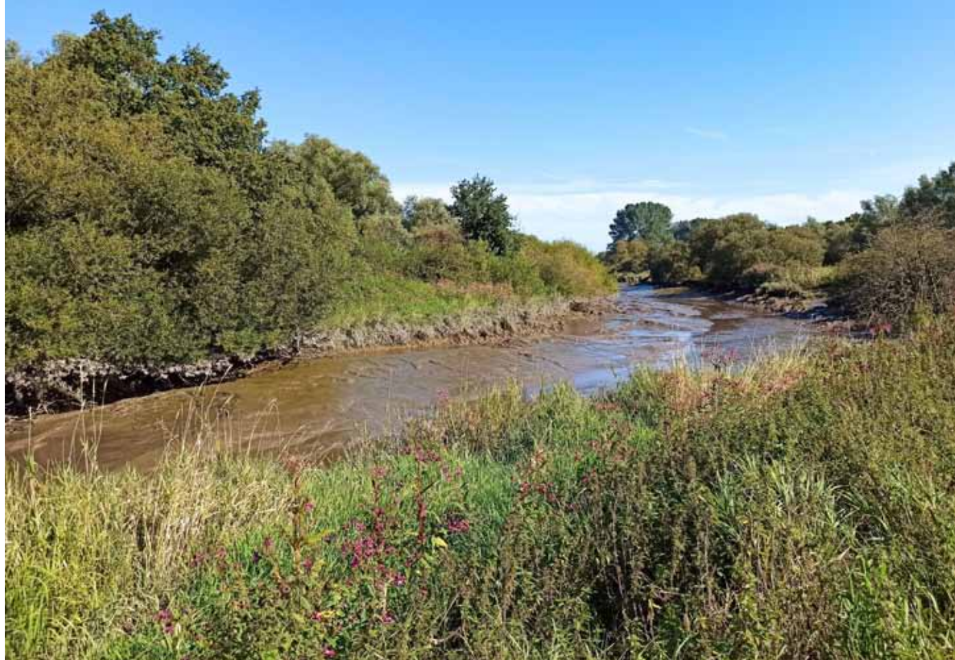
Der Ems-Altarm bei Borsum im heutigen Zustand.