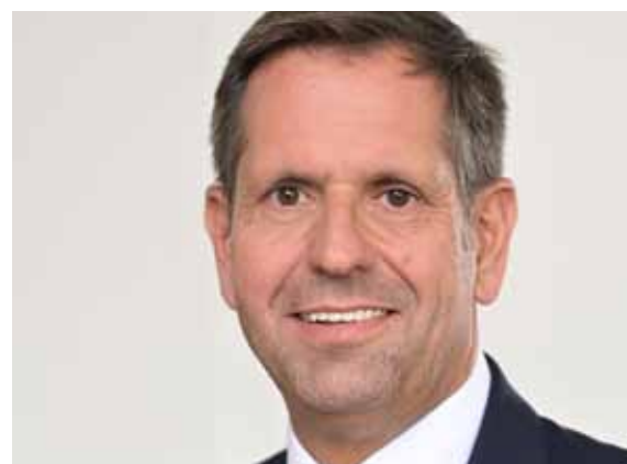
Olaf Lies, Niedersächsischer Minister für Wirtschaft, Verkehr, Bauen und Digitalisierung. Er war in der vorigen Legislaturperiode als Umweltminister zuständig für den Masterplan Ems.

Als Land Niedersachsen stehen wir nicht nur für den Erhalt der Wirtschaftskraft in der Region, sondern auch für den Schutz des Naturraums an der Ems und die Verbesserung ihres ökologischen Zustands. An der Ems befindet sich ein weltweit führender Werftstandort und weitere Unternehmen, die viele tausende Arbeitsplätze vorhalten und zur Sicherung der Lebensgrundlage vieler Men-