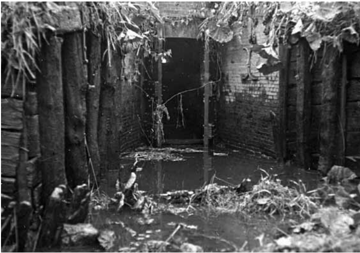
Altes Siel Ostermeedland bei Leer, das im Zuge der Errichtung des Ledasperrwerkes abgerissen wurde.